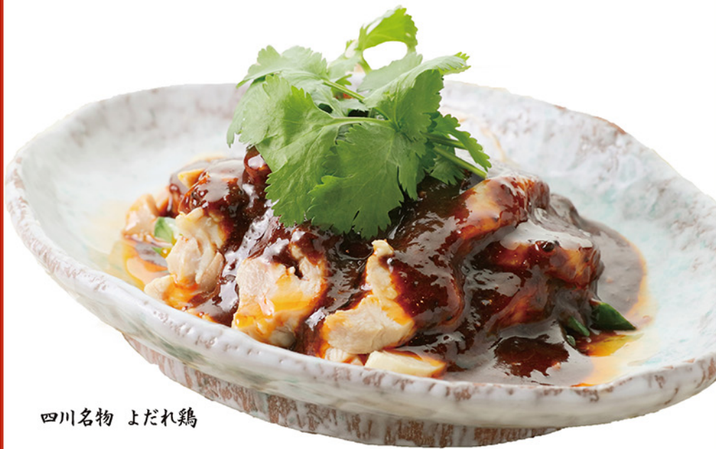
四川名物 よだれ鶏