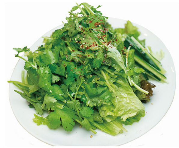
パクチーグリーンサラダ